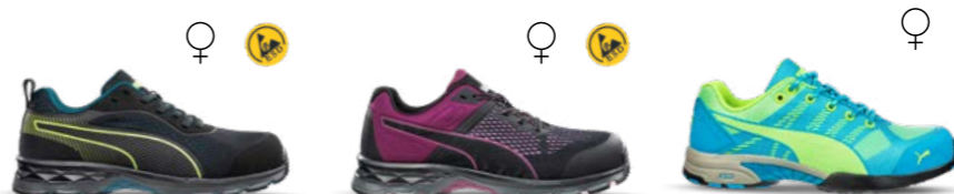
64.393.0 FUSE KNIT BLACK WNS LOW S1P ESD HRO SRC 64.392.0 DEFINE WNS LOW S1P ESD HRO SRC 64.290.0 CELERITY KNIT BLUE WNS LOW S1P HRO SRC