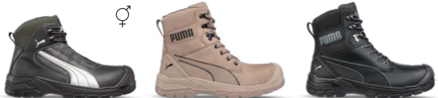
63.021.0 CASCADES MID S3 CI HI HRO SRC 63.074.0 CONQUEST STONE HIGH S3 CI HI HRO SRC 63.073.0 CONQUEST BLK CTX HIGH S3 CI HI WR HRO SRC