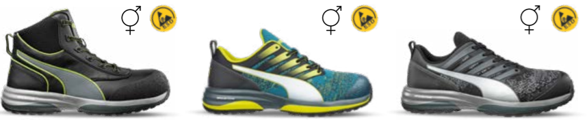
63.550.0 RAPID GREEN MID S3 ESD HRO SRC 64.452.0 CHARGE GREEN LOW S1P ESD HRO SRC 64.454.0 CHARGE BLACK LOW S1P ESD HRO SRC