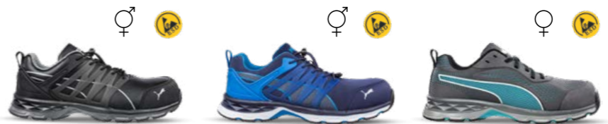
64.384.0 VELOCITY 2.0 BLACK LOW S3 ESD HRO SRC 64.385.0 VELOCITY 2.0 BLUE LOW S1P ESD HRO SRC 64.390.0 FUSE KNIT BLUE WNS LOW S1P ESD HRO SRC