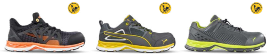
63.387.0 RUSH 2.0 MID S1P ESD HRO SRC 64.380.0 PACE 2.0 YELLOW MID S1P ESD HRO SRC 64.388.0 FUSE MOTION 2.0 GREEN LOW S1P ESD HRO SRC