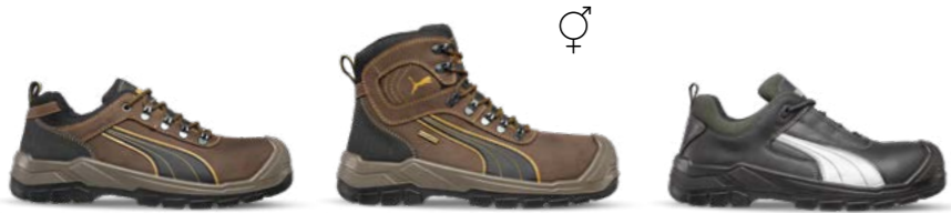
64.073.0 SIERRA NEVADA LOW S3 CI HI HRO SRC 63.022.0 SIERRA NEVADA MID S3 CI HI WR HRO SRC 64.072.0 CASCADES LOW S3 CI HI HRO SRC