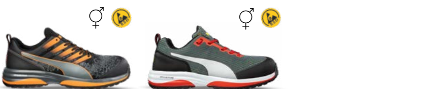
64.455.0 CHARGE ORANGE LOW S1P ESD HRO SRC 64.450.0 SPEED GREEN LOW S1P ESD HRO SRC