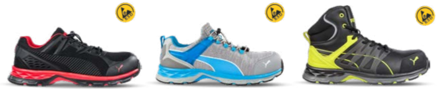
64.389.0 FUSE MOTION 2.0 RED MID S1P ESD HRO SRC 64.386.0 XCITE GREY LOW S1P ESD HRO SRC 63.388.0 VELOCITY 2.0 YELLOW MID S3 ESD HRO SRC